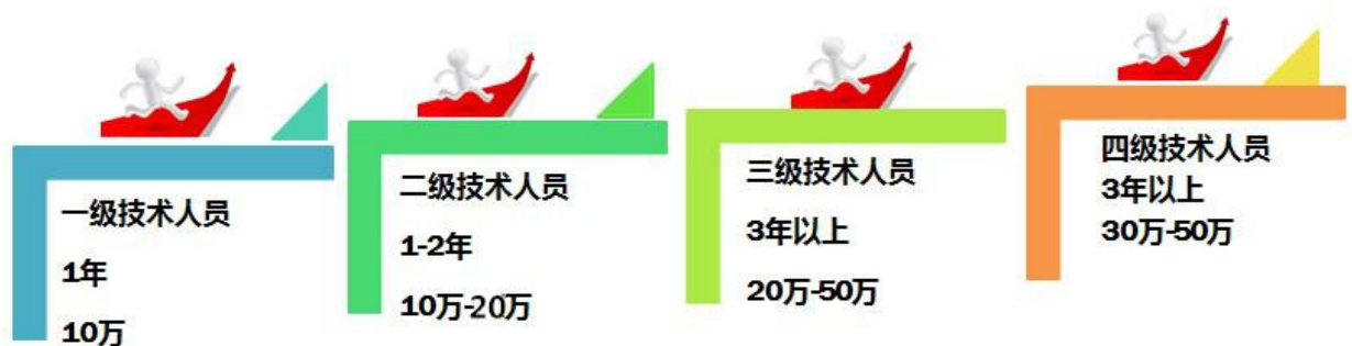
薪资横向晋升流程图