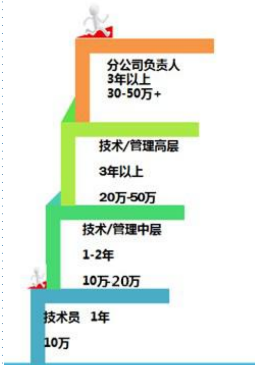
岗位纵向晋升流程图